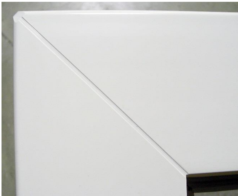
Das ist die zuvor verwendete 5-mm-Nut.

Bei allen weiteren Fragen stehen wir Ihnen natürlich gern zur Verfügung!